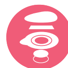
Sensore in argento