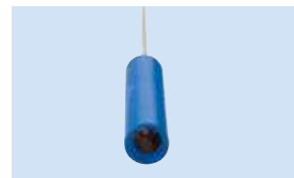
A = Connettore 4 mm