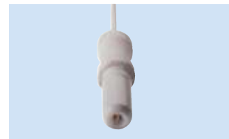
K = Connettore 1,5 mm