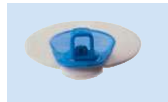
A = Connettore 4 mm