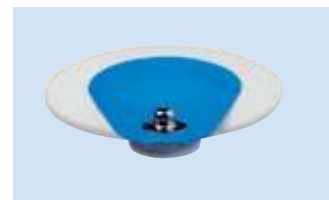
S = Bottone